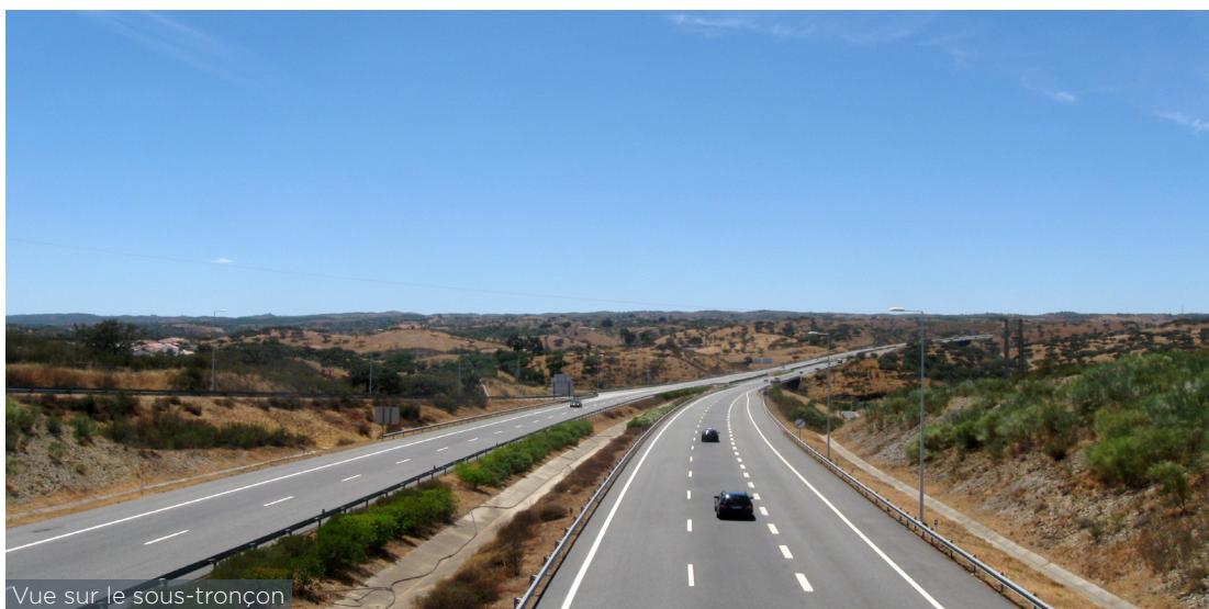
Vue sur le sous-tronçon