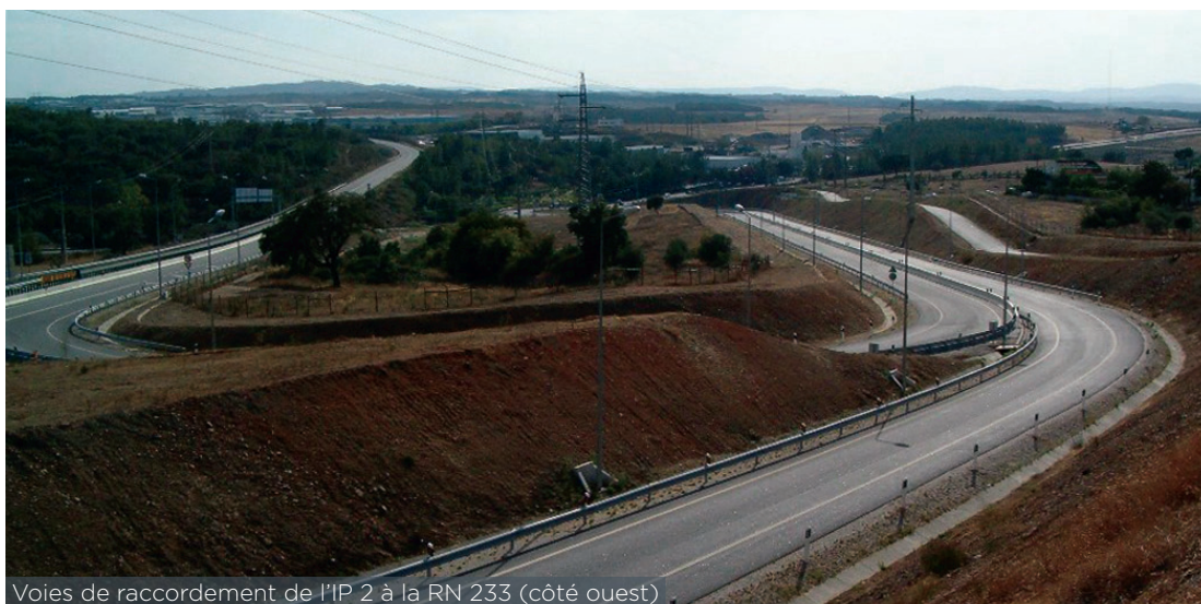
Voies de raccordement de l'IP 2 à la RN 233 (côté ouest)