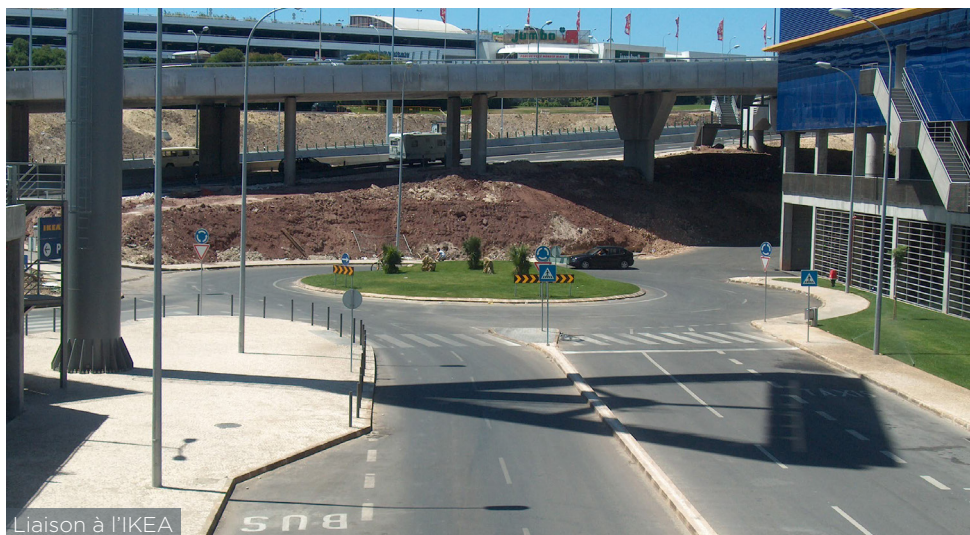
Liaison à l'IKEA