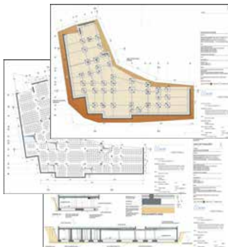
Exemplos de peças desenhadas