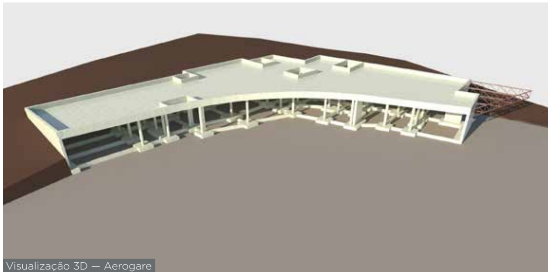
Visualização 3D — Aerogare