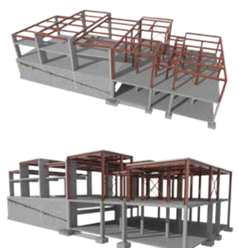
Visualização 3D — SSLCI