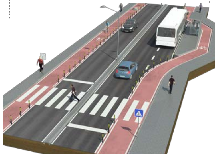
PASSEIRA INTELIGENTE COM LEDS