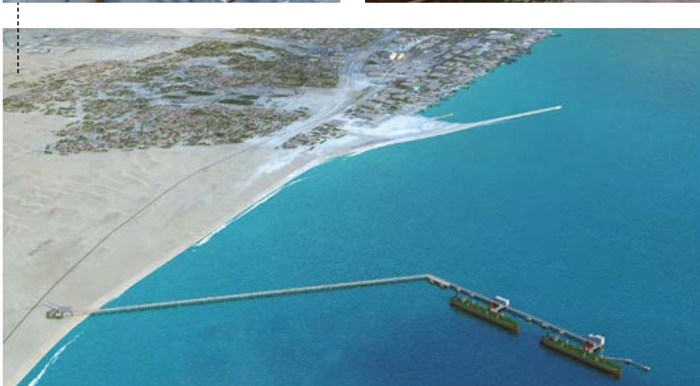
TRABALHOS DE CONSTRUÇÃO DO VIADUTO E DA ZONA DE ATRACAGEM