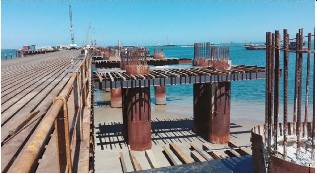
TRABALHOS DE CONSTRUÇÃO DO VIADUTO E DA ZONA DE ATRACAGEM

Este parque conta com dois reservatórios de 20 000 m 3 para gasóleo para automóveis, dois reservatórios de 10 000 m 3 de gás para veículos motores e três reservatórios de 5000 m 3 para gasóleo, combustível para aviação e fuelóleo pesado (HFO).