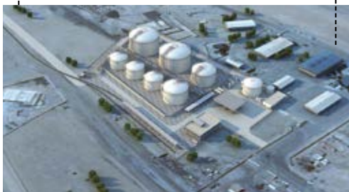
VISTA AÉREA DO TANK FARM