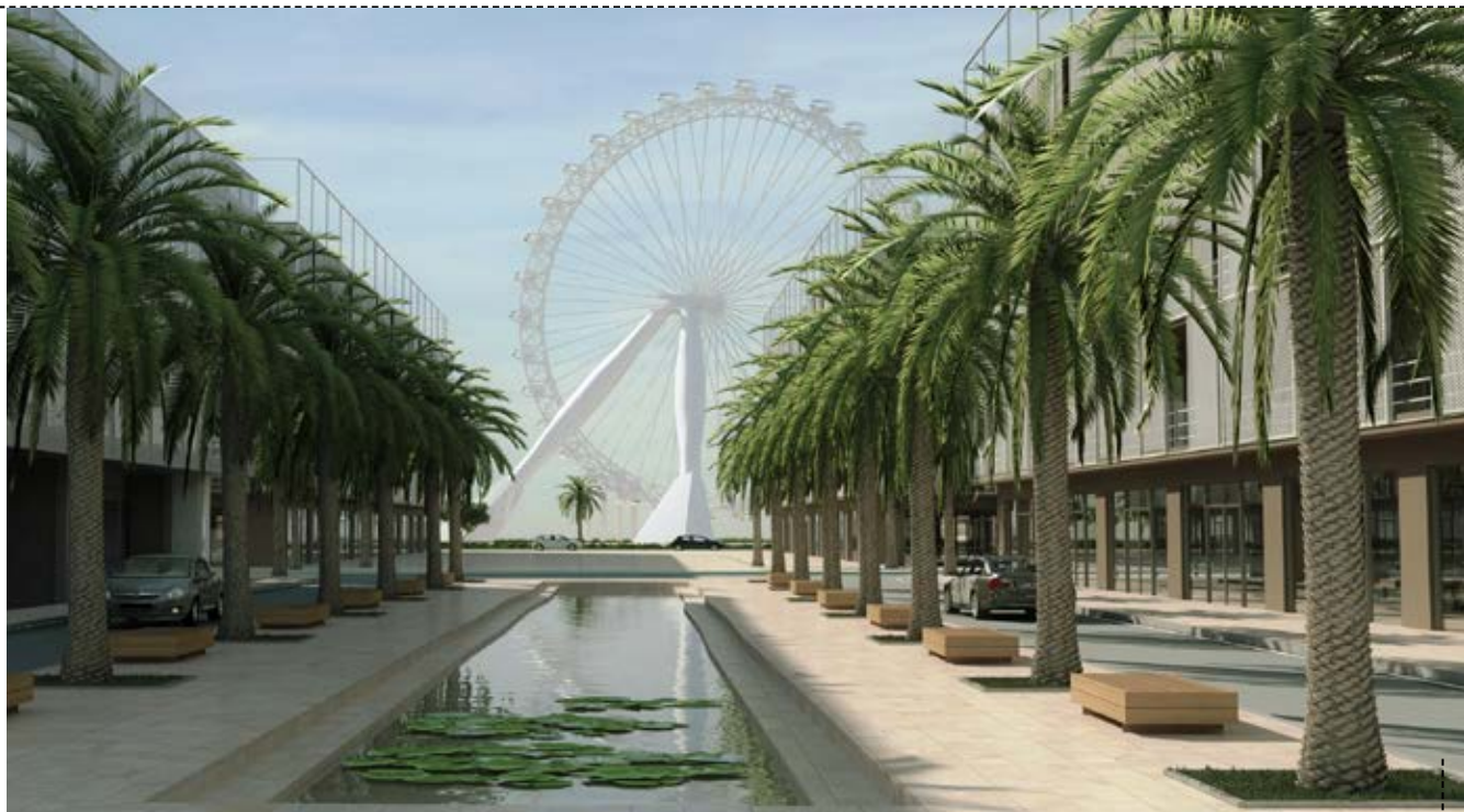
RUA DE ACESSO À MARGINAL

Tendo estes números e esta realidade como base, o novo Master Plan teve em conta o desenvolvimento de novas áreas urbanas dotadas de equipamentos administrativos, governamentais e financeiros, assim como habitacionais. O projeto trouxe, assim, uma renovada vitalidade à organização urbana da capital marroquina.