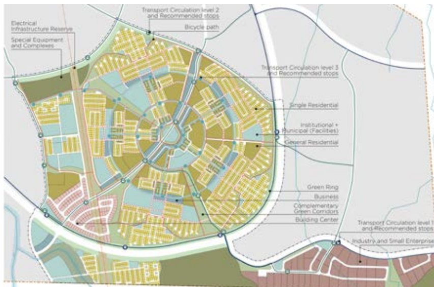
PLANEAMENTO TERRITORIAL E URBANO DA UNIDADE OPERACIONAL 1

A A1V2 é responsável pela Gestão do Projeto, pelo Planeamento Territorial e Urbanismo, pelo apoio às componentes de Paisagismo, Sistema Integrado de Mobilidade e Transporte e Sistema de Micro Acessibilidade.