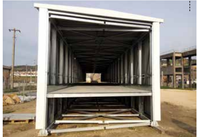
ESTRUTURA DA PASSAGEM SUPERIOR