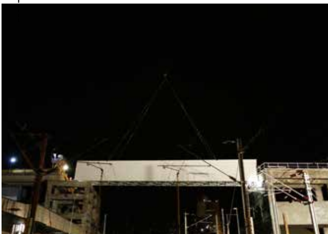
MONTAGEM DA PASSAGEM SUPERIOR