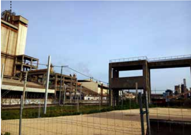
ESTRUTURAS DE BETÃO EXISTENTES