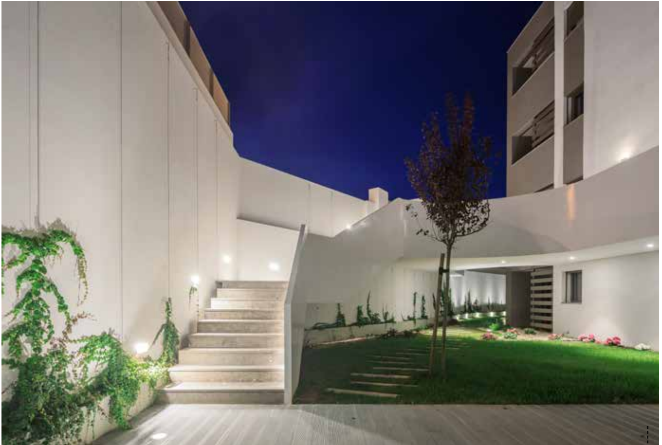
ACESSO AO JARDIM COMUM

Considerando a sua localização de eleição, na primeira linha de edificação costeira e a 30 m da praia, o edifício foi projetado e as frações distribuídas com o objetivo de que todos os apartamentos usufruam de vista para o mar.