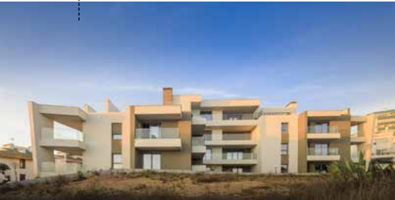
VISTA DO PÁTIO DE ACESSO AO PRÉDIO