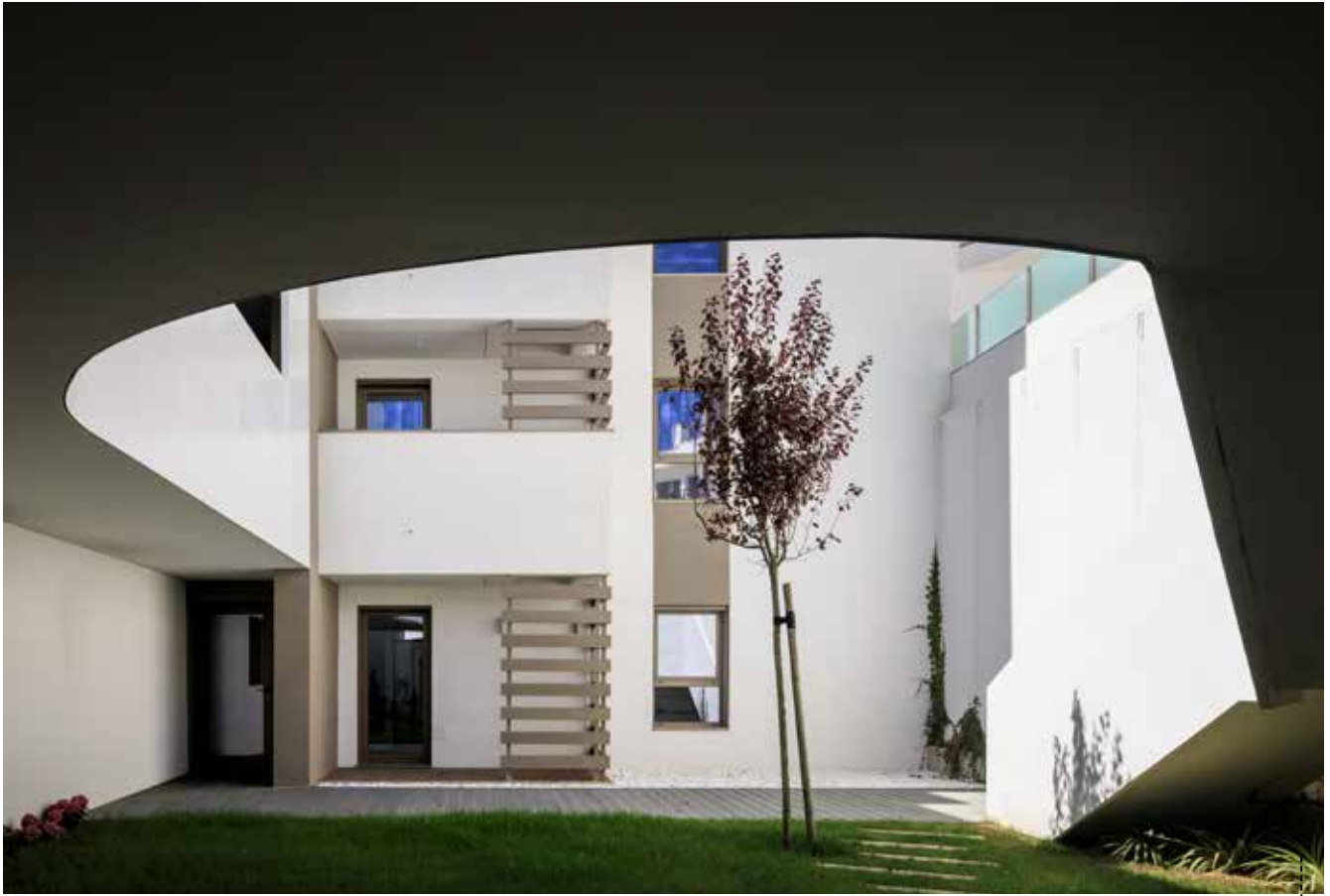
VISTA DO PÁTIO COMUM