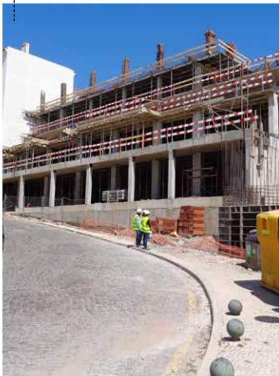
VISTA DA OBRA