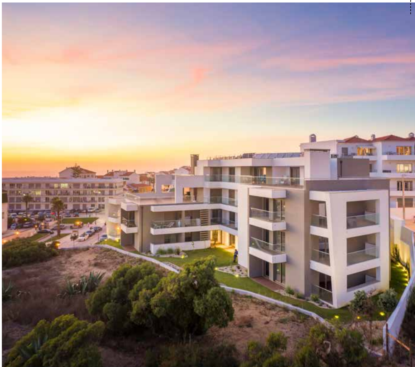
VISTA DO ALÇADO POENTE

Com uma área de implantação de 920 m 2 e uma cêrcea de 16 m, o edifício concretiza uma solução formal cujos avanços e recuos, resultantes do cumprimento de parâmetros regulamentares e da adaptação às confrontações, foram otimizados para afirmar uma volumetria dinâmica e apelativa. Este dinamismo formal foi ainda enriquecido pelas opções materiais e pela composição cromática dos diversos elementos de fachada, ora destacando planos avançados, ora diferenciando superfícies recuadas.