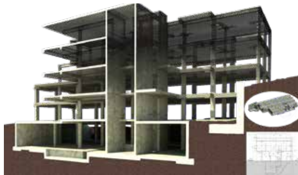
MODELO DE CÁLCULO BIM (ROBOT)