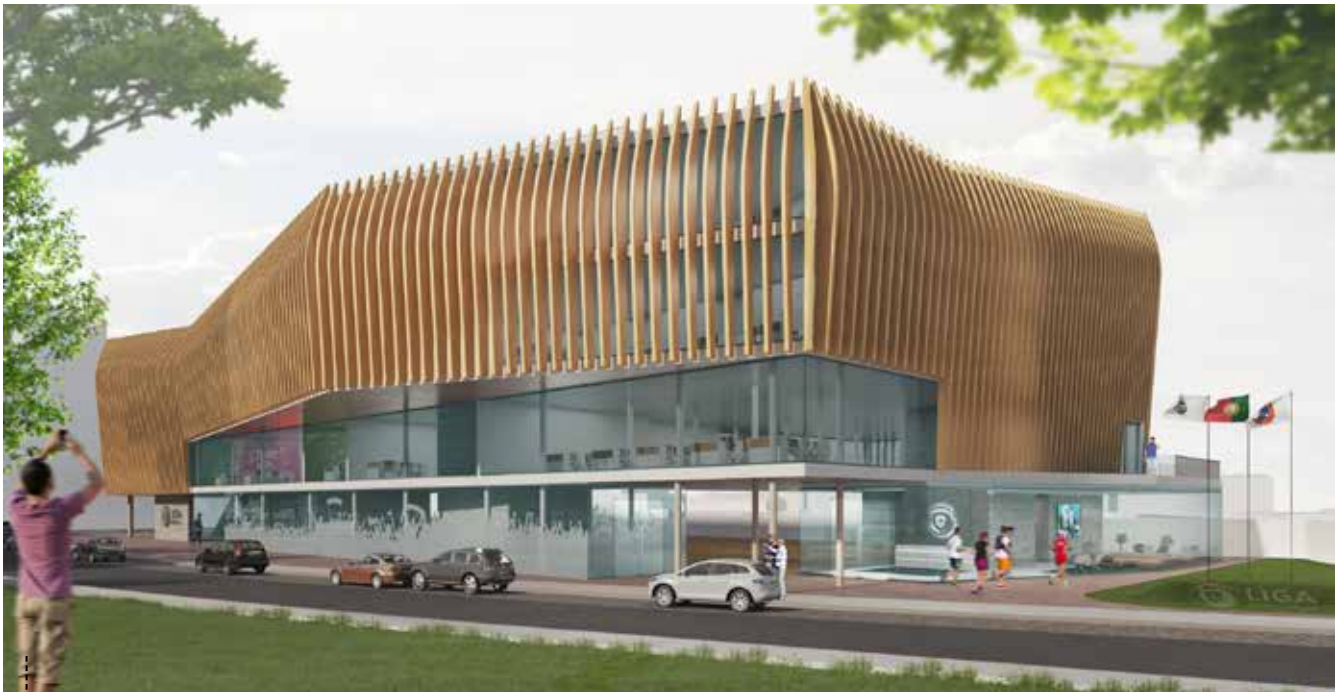
ALÇADO DA RUA JOHN WHITEHEAD – RECEÇÕES DO ED. SEDE DE INVESTIGAÇÃO E DESENVOLVIMENTO

A proposta assenta em três conceitos-chave: