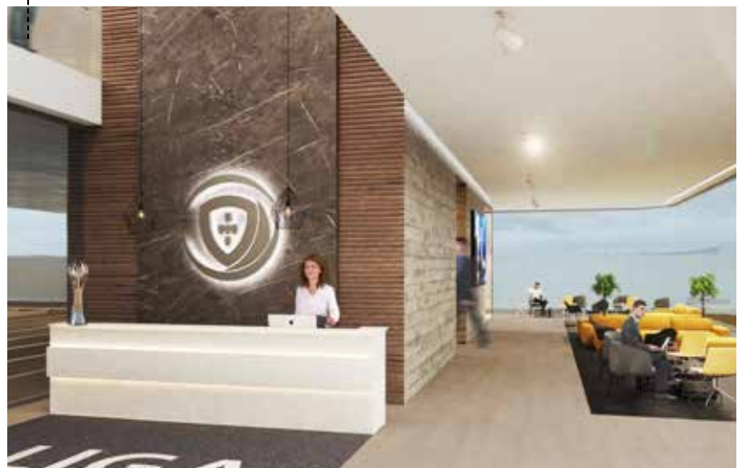
RECEÇÃO DO EDIFÍCIO SEDE