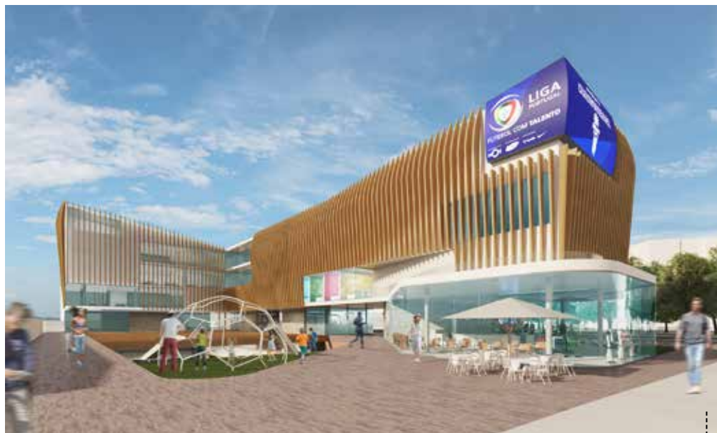
ALÇADO DA RUA PADRE DIAMANTINO GOMES — LOJA, MUSEU E CAFETARIA