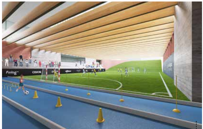
FUTEBOL HIGHTECH E CAMPO DE JOGO

3. Aplicação de uma “pele” a envolver as fachadas de toda a volumetria, acima do Piso 1, respondendo à necessidade de sombreamento dos vãos de vidro nas fachadas e fortalecendo a ideia pretendida no ponto anterior. Por este meio, dissimula-se a introdução dos vãos nas fachadas deste volume. Por vezes, a pele é interrompida para permitir o acesso a varandas/terraços ou a fim de destacar alguma zona da fachada.