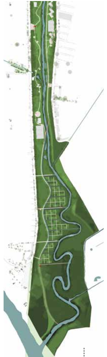
PLANTA GERAL DE INTERVENÇÃO (CON.)

Escultura e Arquitetura, representada por um jardim de esculturas que acompanha a margem esquerda do rio e deixa visível, onde o leito do rio se alarga criando uma área de parque público aberto implantado um elemento arquitetônico marcante e que abriga um equipamento de apoio ao parque; Pintura e Literatura, com maior foco na margem esquerda do rio, onde o parque começa a adquirir um caráter mais natural, os temas da pintura e da literatura são formalizados por meio de uma rede de caminhos e pontos de vista que se projetam pontualmente nas margens do rio e