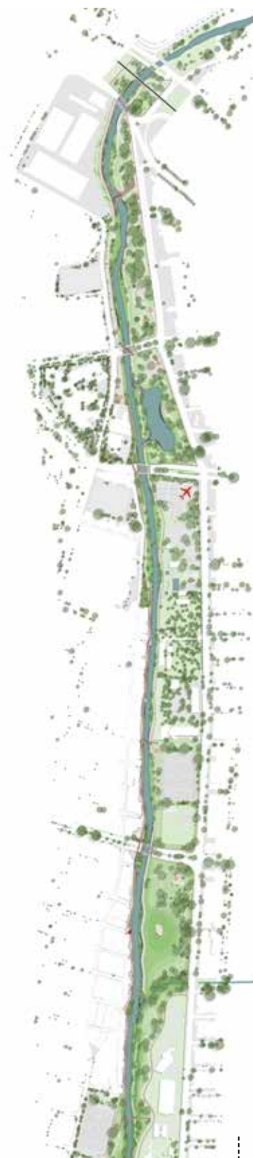
PLANTA GERAL DE INTERVENÇÃO

A aposta na concretização de um desenho de restauro ecológico e ambiental de baixo impacto , com infraestruturas de contenção da erosão paralelas ao fluxo fluvial, permitiria a diminuição da velocidade do caudal do rio e a existência de pequenos abrigos fluviais para fauna urbana.