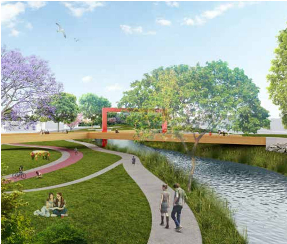
VISTA DE RUA