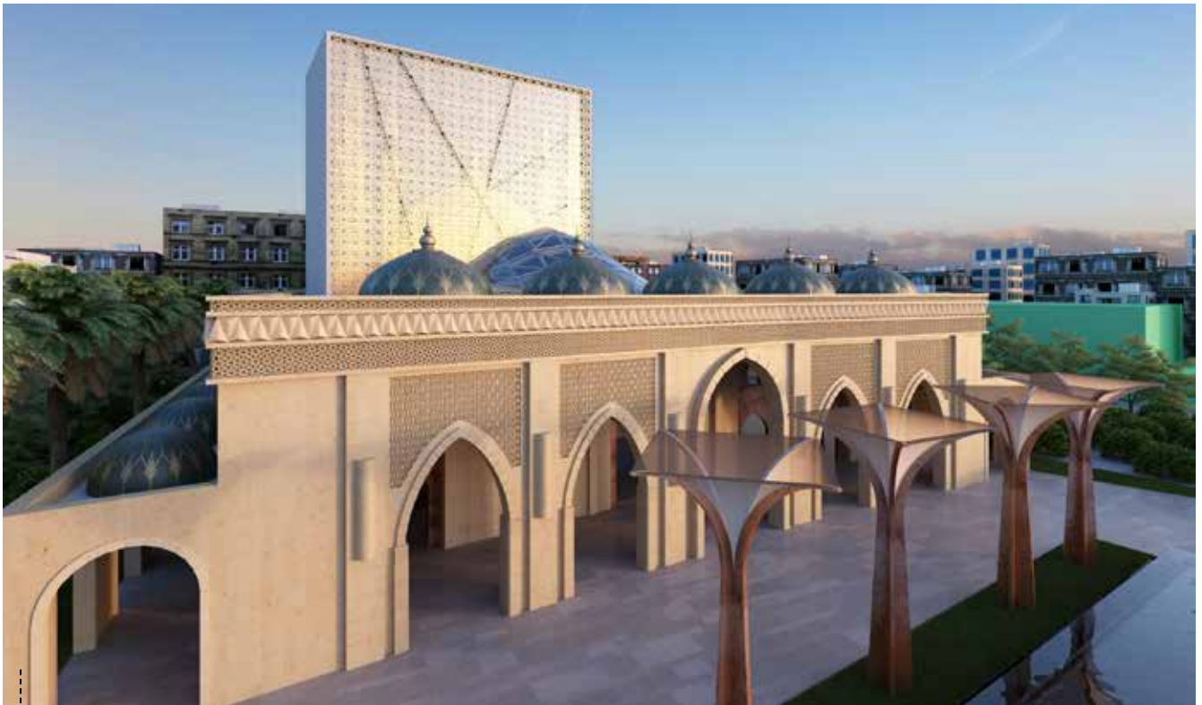
VISTA DO EXTERIOR

Deu-se também grande importância aos materiais texturados, bem como às estereotomias e desenhos de pavimento, procurando valorizar e realçar cada um dos compartimentos.